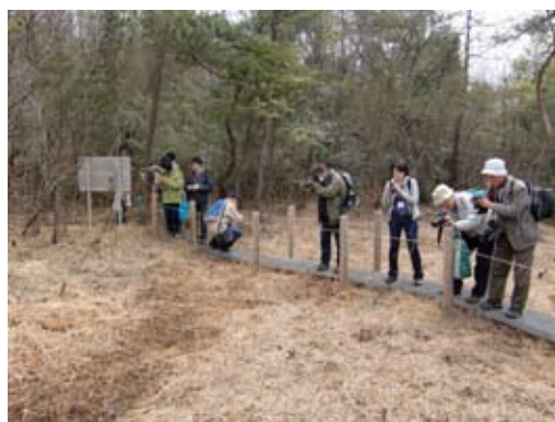
1列に並んで湿地を観察。

ですが、シデコブシは華奢で細い枝はしだれるかの様に曲がっています。その樹形のおかげで、手の届く位置に花が咲いていて、写真撮影には好都合でした。採集できないせいか、撮影に気合を入れる方も多く、ベスト・ポジションにある花には順番待ちができるほどでした。そんな私たちの様子を遠巻きにうかがっていた人々がいて、北海道の調査地で登山者から説教めいた質問をされたことのある私はちょっと心配してしまいました。が、私たちが去ると同時に彼らもカメラを取り出してシデコブシを撮影し始めました。地元でも知る人ぞ知る花なのですね。