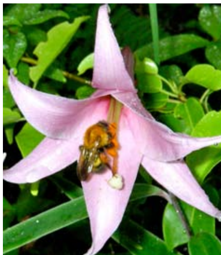
図2. 訪花するトラマルハナバチ