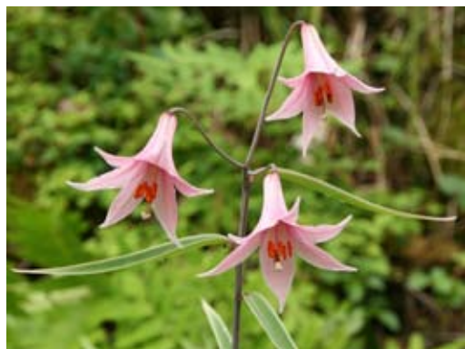
図1. ジンリョウユリ Lilium japonicum var. abeanum

詳しく調べてみると、ササユリでは葯が花糸にT字型に付き、ジンリョウユリではI字型に付くという違いがあることが分かりました。またササユリの開花時間は夜間であると報告されていましたが、ジンリョウユリでは7割の個体が夜間で、3割は昼間であることが分かりました。開花時間が多型的なのは、訪花数は多いが花粉を食害するため送粉効率が低いハチと、訪花数は少ないが送粉効率は高い夜行性のガの間で、最も全体の送粉効果