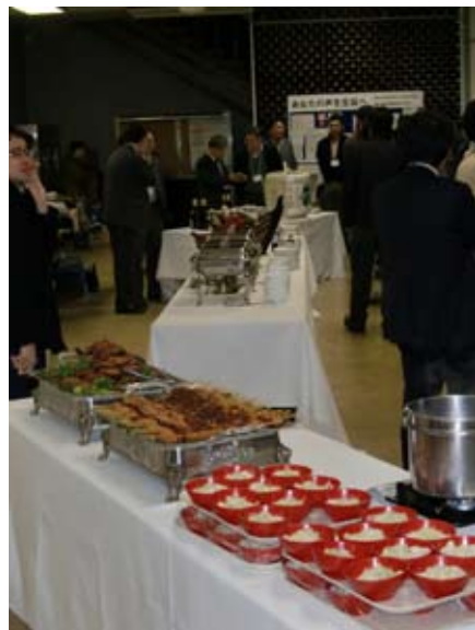
懇親会の様子。手前にはきしめん、味噌カツ、手羽先。奥には樽酒が。

最後に、参加者の皆様に改めてお礼を申し上げますと共に、会長をはじめ大会運営にご協力下さりました学会事務局の皆様、座長を快くお引き受け下さった先生方、シンポジウムで講演を快くお引き受けて下さった先生方、さらには大会運営に直接関わっていただいた多くの関係者の皆様には心から感謝いたします。どうもありがとうございました。