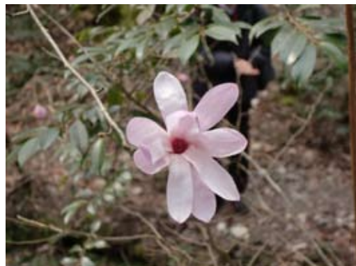
ベスト・ポジションにあったシデコブシの花。

歩くこと数十分でシデコブシ生育地に到着しました。付近は緩やかな斜面で、水の流れがほとんどない深くえぐれた幅の狭い流れがありました。その左右岸に3～4個体が花を咲かせていました。開花個体が少ないため、採集は中止と告げられました。花色は個体によって少しずつ違い、白っぽいものから濃桃色までバリエーションがありました。意外だったのが、シデコブシの樹形です。私はモクレンやキタコブシのように比較的真っ直ぐ垂直に伸びる樹形を勝手に想像していたの