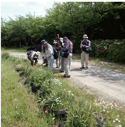
野外観察会風景 2014年4月27日、大洲市長浜町

【HP】 http://ehimebotanicalclub.web.fc2.com/