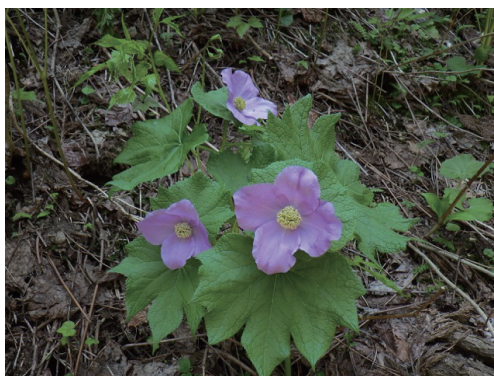
学会シンボルマークのシラネアオイが至るところに

昼食をとった林道沿いはシラネアオイ、ザゼンソウが競うように咲いていた。キクザキイチゲも最後の花を我々の前に思いっきり広げていた。ここからは本日最も長いトレッキングである。しかも自然度が高い森林の中を歩く。アケボノシュスラン、コショウノキ、コブシ、ミヤマカタバミ、オニシモツケ、シナノキなどはこのルートで初めて出現したように記憶している。歓声が上がったのはカタクリの花に遭遇した時だ。終わった花や果実は随所で見したが、ルートの方で見事な花を見つけた時は感慨深いものがあった。北日本では珍しいものではなく、しかもかなりの群生地が各県に知られている。今回は期待できないと半ば諦めていた花が見られ、疲れが吹き飛んだ瞬間であった。