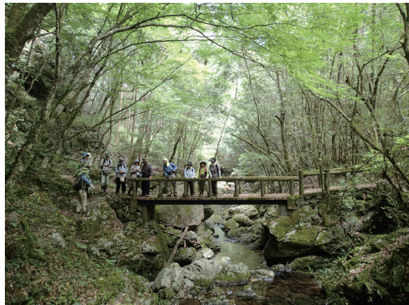
野外観察会風景 2014年5月25日、西予市桂川溪谷