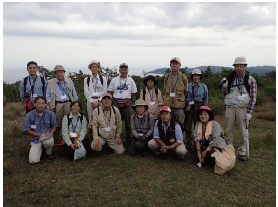
大山山頂の蛇紋岩地帯にて。参加者のうち2名が別行動だったため、写真に写っていない

観察できた植物の一部：ホソバカナワラビ（オシダ科）、ホラシノブ（ホングウシダ科）、ネズミサシ（ヒノキ科）、ハチジョウキブシ（キブシ科）、ヤブニッケイ（クスノキ科）、オオバグミ（グミ科）、ツゲ（ツゲ科）、ジングウツツジ（ツツジ科）、ヒロハドウダンツツジ（ツツジ科）、ウバメガシ（ブナ科）、オトギリソウ（オトギリソウ科）、キキョウ（キキョウ科）、アキノキリンソウ（キク科）、サジガクビソウ（キク科）、ナガバノコウヤボウキ（キク科）、ヒヨドリバナ（キク科）、スズサイコ（キョウチクトウ科）、アキカラマツ（キンポウゲ科）、タイミンタチバナ（サクラソウ科）、アキノタムラソウ（シソ科）、イブキジャコウソウ（シソ科）、オトコエシ（スイカズラ科）、シンミズヒキ（タデ科）、オニドコロ（ヤマノイモ科）