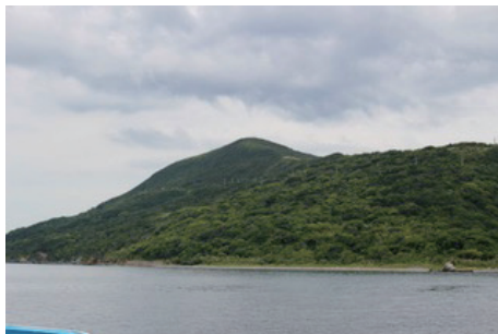
写真1. 萱島(大山山頂が見えている)

出発点は島の北東部の端にあたり、そこから南西方向へ島の最高峰大山(236.6 m)を目指して歩き、山頂から北東部へ降りて出発点に戻る輪を描いたような観察ルートであった。出発点である島唯一の集落を抜けると背の低い樹木の間を登山道が続く。ここでは、私の住んでいる京都で見ることのないサカキカズラ、オオフユイチゴ、ホウライカズラに出会った。他にはフウトウカズラ、カンアオイ、マンリョウ、タイミンタチバナ、ハマクサギ、アキカラマツなどが見られた。