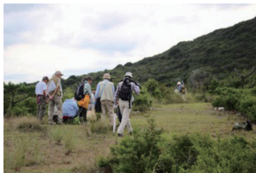
写真3. 大山山頂付近

気がつくと夕暮れ時が近づいており、あわてて来た道とは反対側の北東の道を集落に向けて急いだ。低地の舗装道路に出た頃にはすっかり真っ暗になってしまった。小さな島なのだが歩いていても歩いていても集落にたどり着けず、だいぶ不安になっていたところに迎えの車に来てもらい無事宿舎につくことができた。