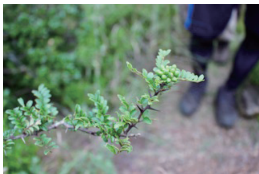
写真2. 矮小化したイヌザンショウ

少し行くと大山の山頂だった。樹木が少しまばらになっていて、ヤマジソ、スズサイコ、ヒロハスズサイコなど珍しい草本に出会った。山頂付近にはトダシバ、イブキジャコウソウ、メギ(紅葉していた!), マルバアオダモ、ヌルデ、ススキ、アカメガシワ、クロマツ、クマヤナギ、モッコク、キキョウ、マツバハルシャギク(北米原産)などが見られた。京都では庭によく植栽されているモッコクだが、ここは自然分布なのだろう。考えてみれば、天然のモッコクとは初めての出会いになる。