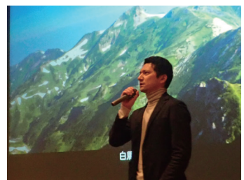
池田先生のご講演