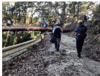
台風による倒木が 林道を塞いでいる様子