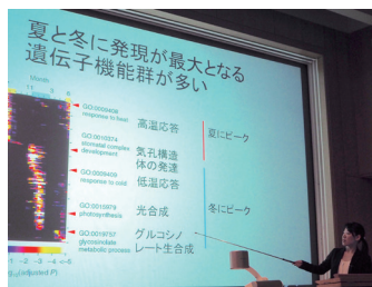
本庄先生のご講演