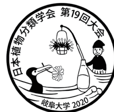
日本植物分類学会第19回大会 ロゴマーク

岐阜大会へ、多数の参加申込をいただき誠にありがとうございます。2月3日現在、参加申込者は、大会事務局の予想を遙かに超える210名、また発表登録は、121件（口頭44件、ポスター77件）となりました。大会事務局は喜びを感じながら、みなさんのご期待にそえるように細心の注意をもって準備をすすめております。そこで大会前の最終NLとして以下の3点をお知らせいたします。