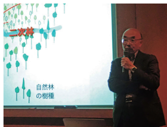
能城先生のご講演