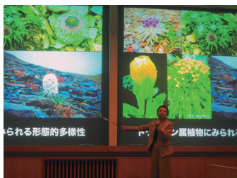
藤川先生のご講演